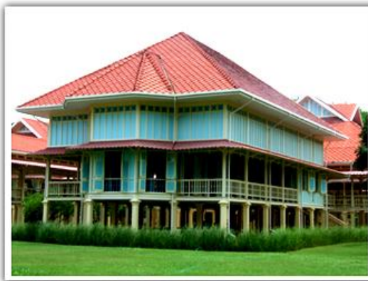
พระที่นั่งสมุทพิมาน

ถ้าอยากทราบภาพก่อนหน้านี้ดูทรูทวิตโรมขนาดไหน เขาก็จัดห้องแสดงภาพ ตลอดจนเรื่องราว มีประวัติความเป็นมาต่าง ๆ ที่น่าสนใจศึกษาไว้ให้ชมเป็นความรู้