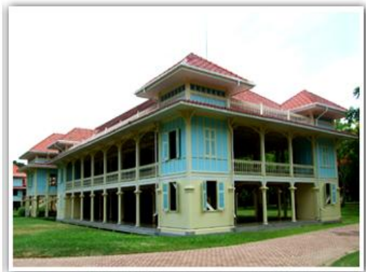
พระที่นั่งสโมสรเสวกามาตย์