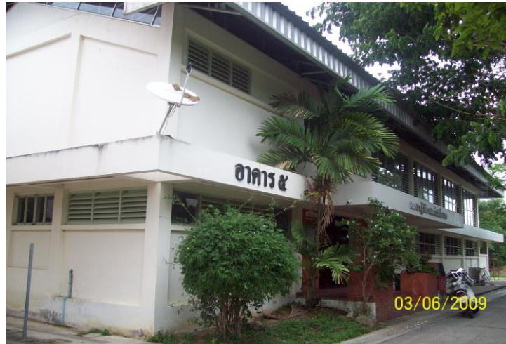
อาคาร 5 ปฏิบัติการเทคโนโลยีอาหาร

อาคารเทคโนโลยีอาหาร เป็นอาคารคอนกรีตเสริมเหล็ก 1 ชั้นครึ่ง สร้างเมื่อ พ.ศ.2540 ใช้เป็นสถานที่เรียนการทำอาหารบรรจุกระป๋อง ขนาดของอาคาร 10 X 27 เมตร ราคา 1,800,000 บาท