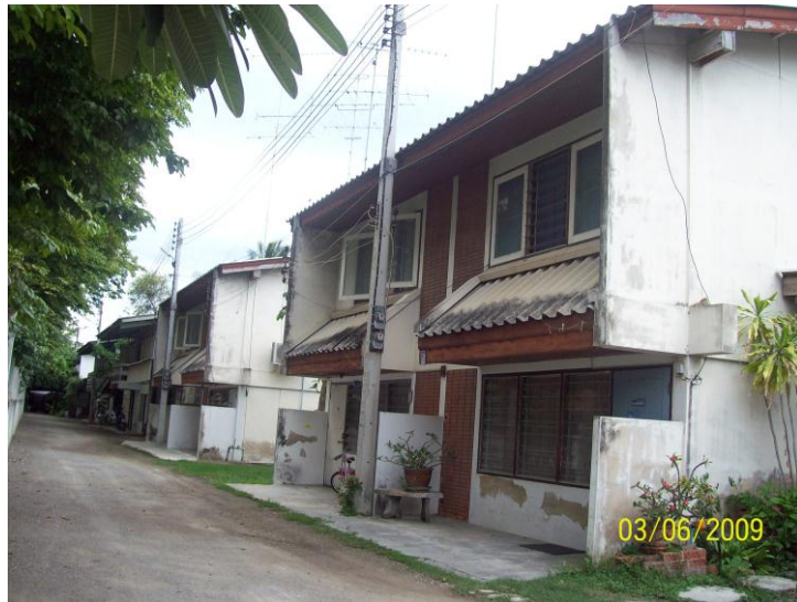
บ้านพักอาจารย์ด้านทิศตะวันออกและทิศตะวันตก

บ้านพักอาจารย์ด้านทิศตะวันออกและทิศตะวันตก สร้างเมื่อ พ.ศ. 2529 เป็นสำหรับที่พักอาศัย