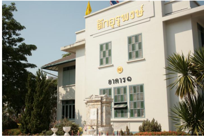
อาคาร 1 ตึกอูรูพงษ์