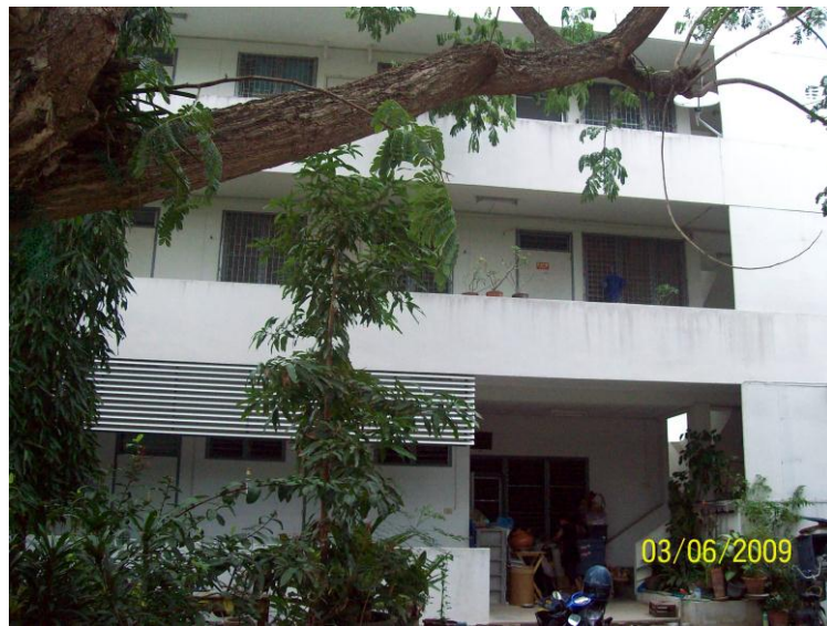
อาคารแฟลตที่พักอาจารย์

บ้านพักอาจารย์ด้านทิศตะวันออกและทิศตะวันตก สร้างเมื่อ พ.ศ. 2529 เป็นสำหรับที่พักอาศัย