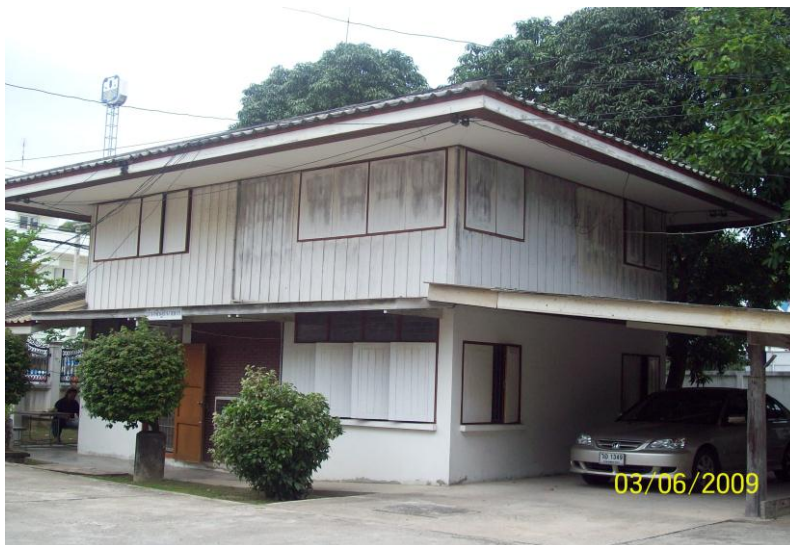
บ้านพักผู้อำนวยการ

อาคารเทคโนโลยีอาหาร เป็นอาคารคอนกรีตเสริมเหล็ก 1 ชั้นครึ่ง สร้างเมื่อ พ.ศ.2540 ใช้เป็นสถานที่เรียนการทำอาหารบรรจุกระป๋อง ขนาดของอาคาร 10 X 27 เมตร ราคา 1,800,000 บาท