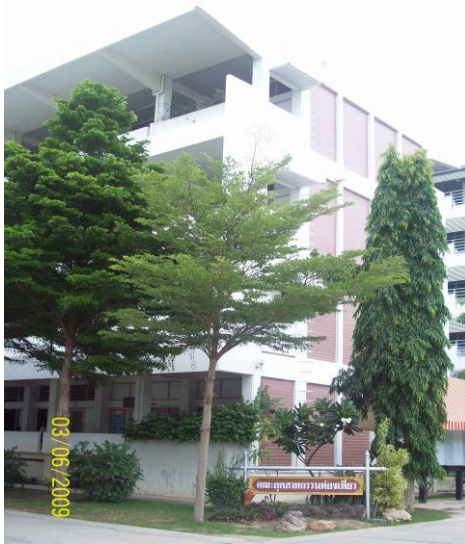
อาคาร 9 อาคารบริหารธุรกิจ 2 และวิชาสามัญ

อาคาร 9 เป็นอาคารคอนกรีตเสริมเหล็ก 4 ชั้น สร้างเมื่อ พ.ศ. 2534